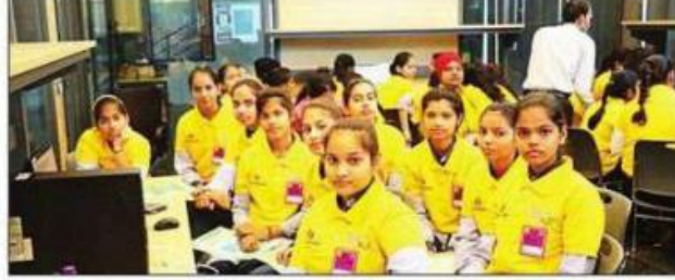
पाइट कॉलेज में आजादी सैट-2.0 के लिए सैटेलाइट प्रोग्रामिंग सीखती छात्राएं। संजय

इन छात्राओं ने इसरो एवं पाइट के विशेषज्ञ शिक्षकों की मदद से सैटेलाइट प्रोग्रामिंग की अब इन्हीं सैटेलाइट को लॉन्च किया जाएगा। इंडियन स्पेस रिसर्च ऑर्गेनाइजेशन (इसरो) ने स्कूली बच्चों को स्पेस रिसर्च के प्रति आकर्षित करने के लिए पिछले वर्ष आजादी सैट मिशन का