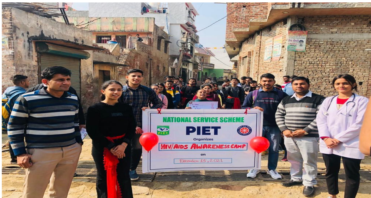
Volunteers during Awareness Campaign at Village Pattikalyana