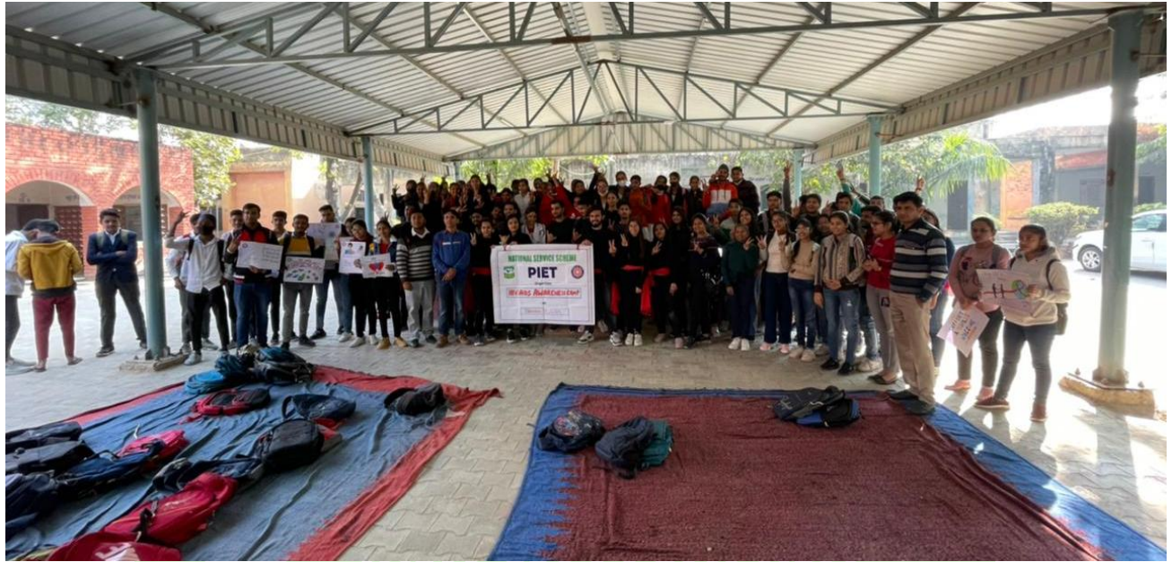
Volunteers during in Nukkad Natak at Govt School Pattikalyana