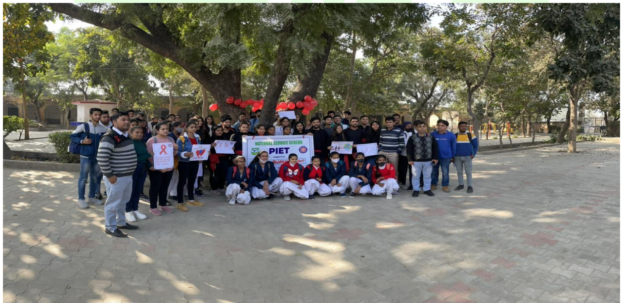
NSS Volunteers participate in Red RibbonTree activity at Govt School Pattikalyana