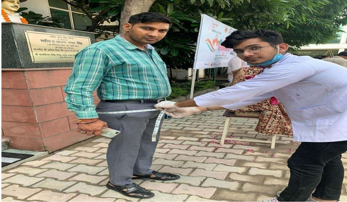
Student calculating BMI index.