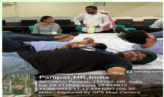
Students photograph during Blood Donation Camp