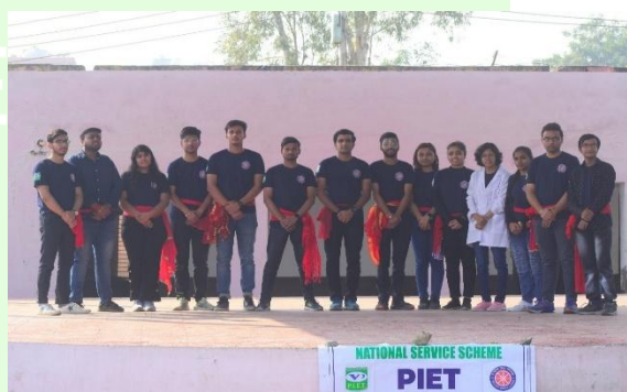
NSS Volunteers During the Nukkad Natak of awareness regarding HIV-AIDS