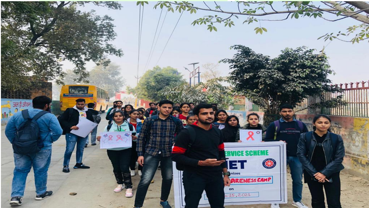
Volunteers during Awareness Campaign at Village Pattikalyana