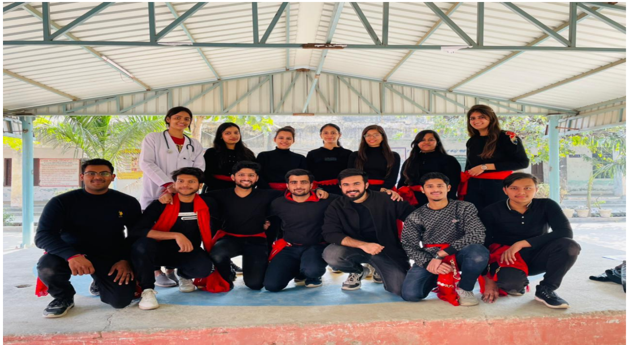
Volunteers participate in Nukkad Natak at Govt School Pattikalyana

This program was organized by NSS unit of Panipat Institute of Engineering and Technology on 1 Dec. 2022 at Government school Pattikalyana. The main motive of this program was to aware people about HIV AIDS and other communicable diseases through Rally, Nukkad Natak and other activities. The Activity was performed in one of the adopted village Pattikalayana.