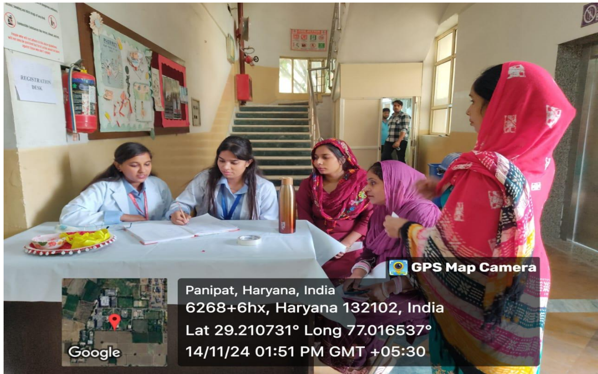
General checkup and counseling during the health check-up camp