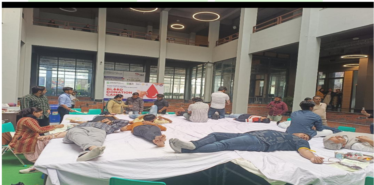
Photograph of the students during Blood Donation