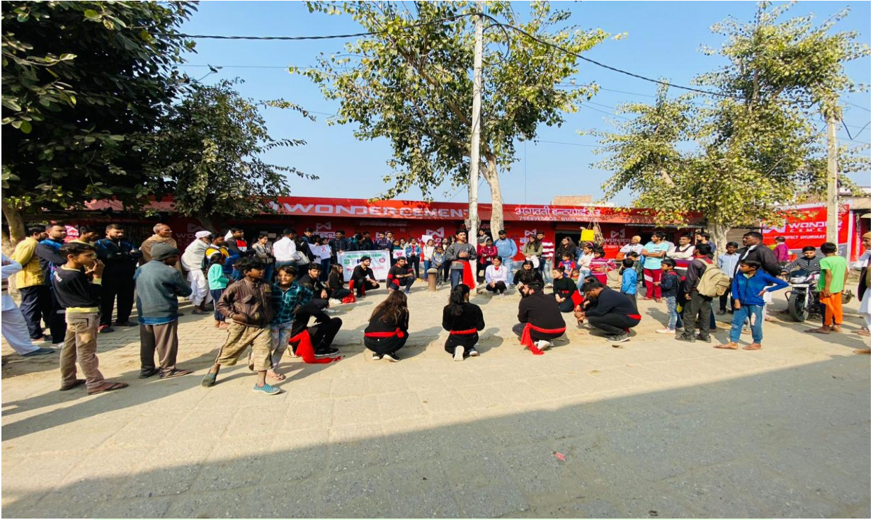
Volunteers during Nukkad Natak at Village Pattikalyana