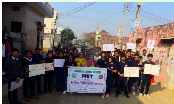
NSS Volunteers During the rally of awareness regarding HIV-AIDS