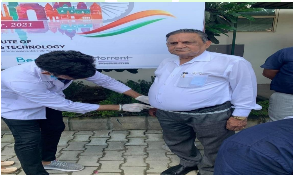
Student calculating BMI index.