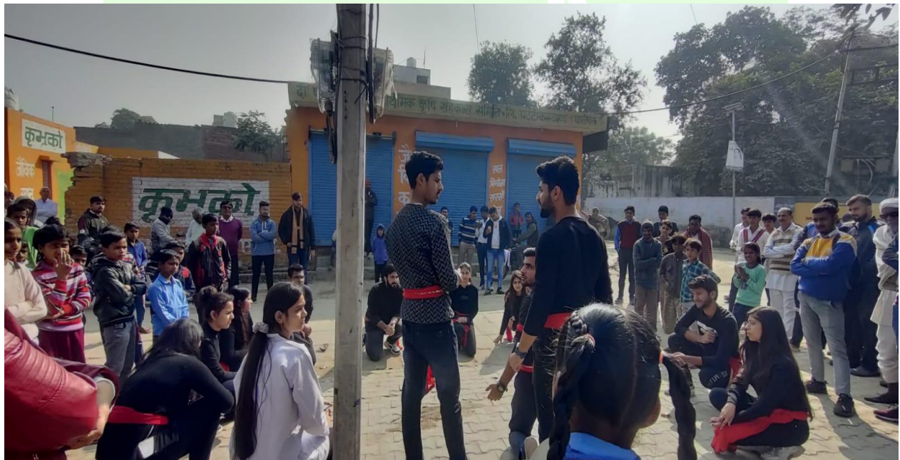
Volunteers during Nukkad Natak at Village Pattikalyana