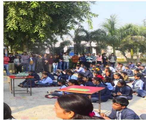
Govt school students and Teachers During the Nukkad Natak at HIV AIDS