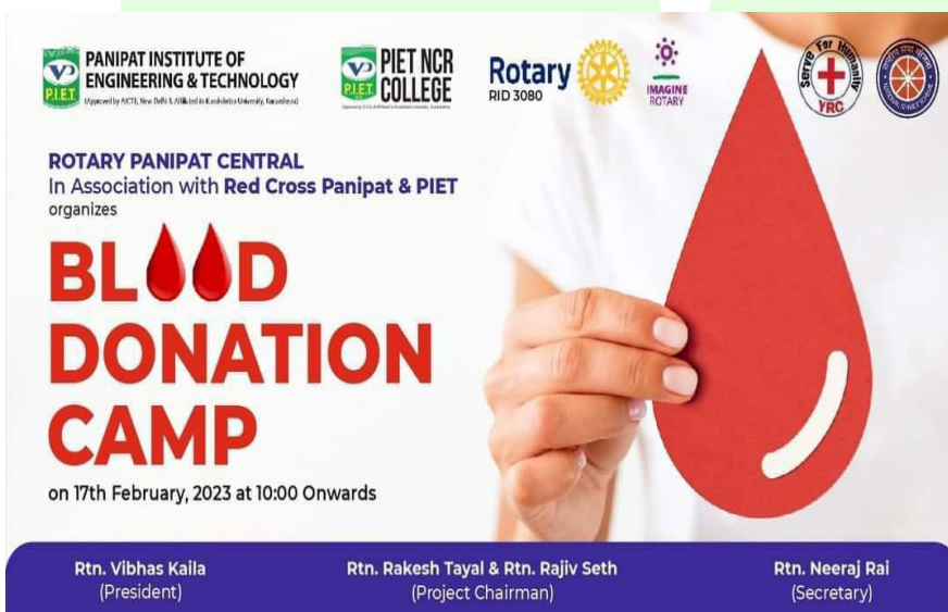
Event Poster for students' information