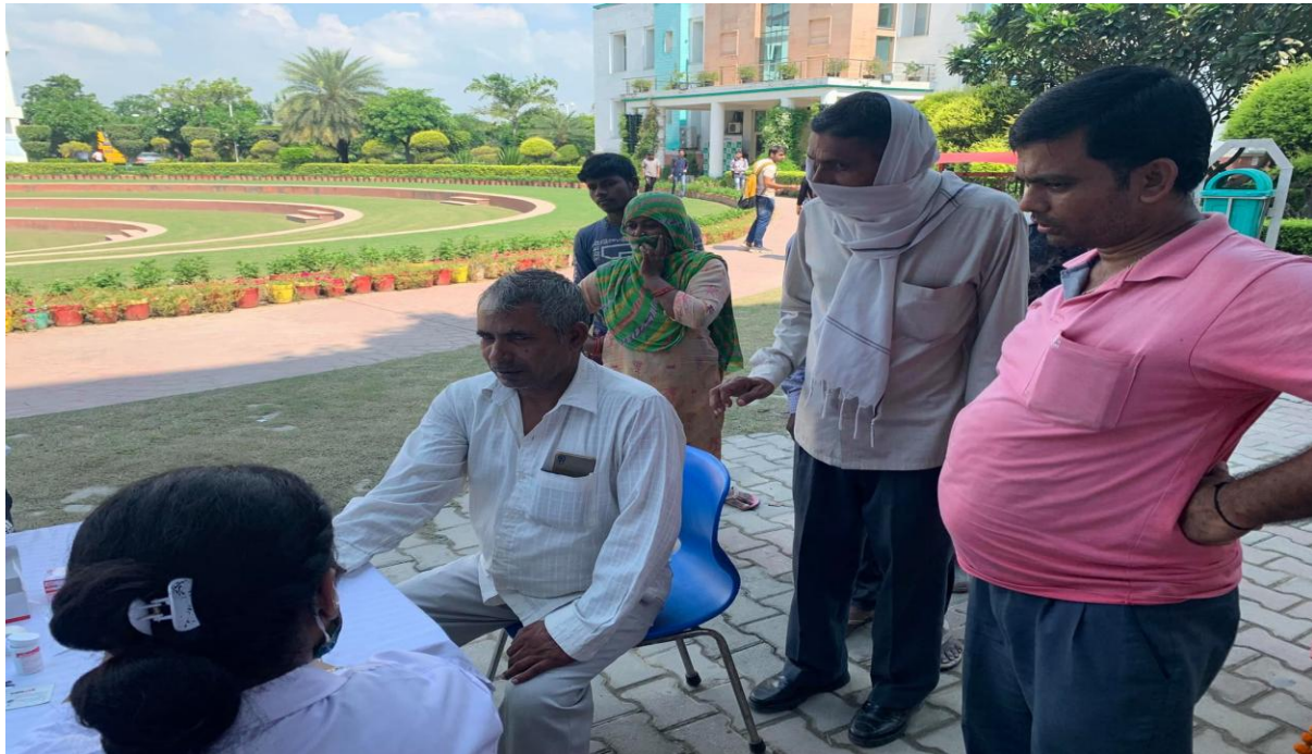
Blood Sugar Testing of Patients