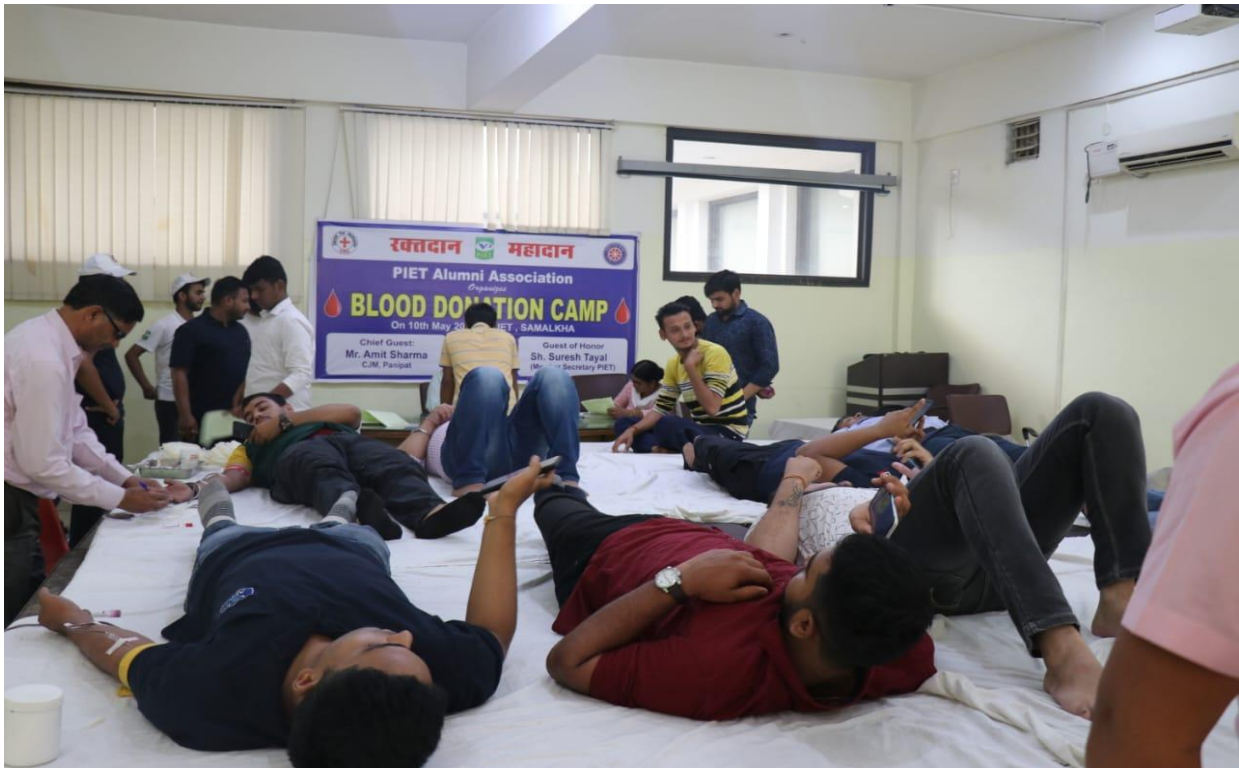
Participants donated blood during the Blood Donation Camp