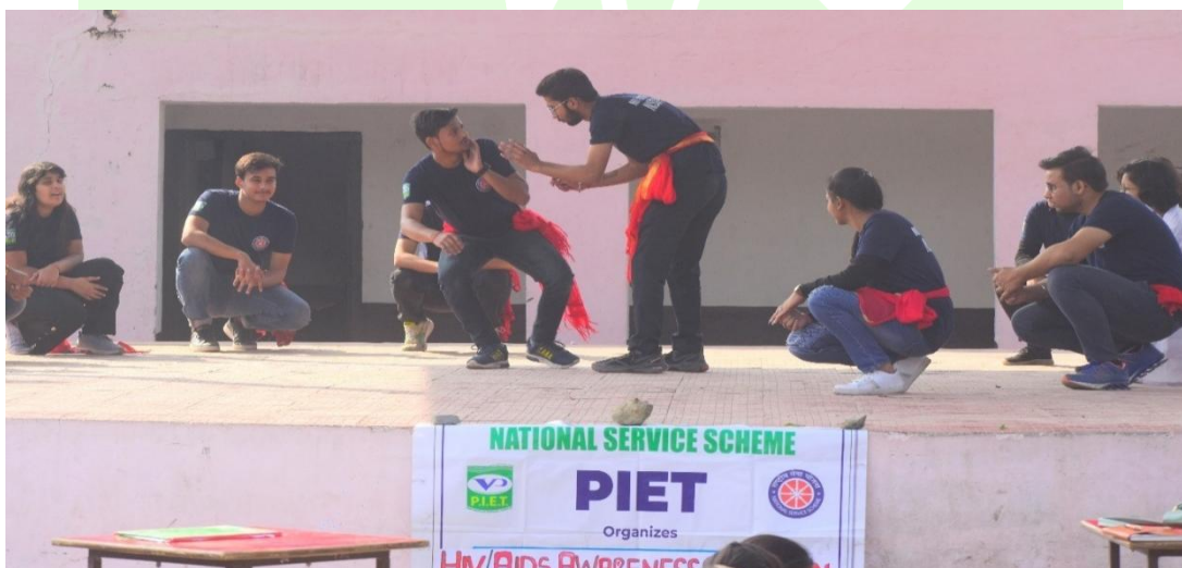
NSS PIET Volunteers During the Nukkad Natak of awareness regarding HIV-AIDS