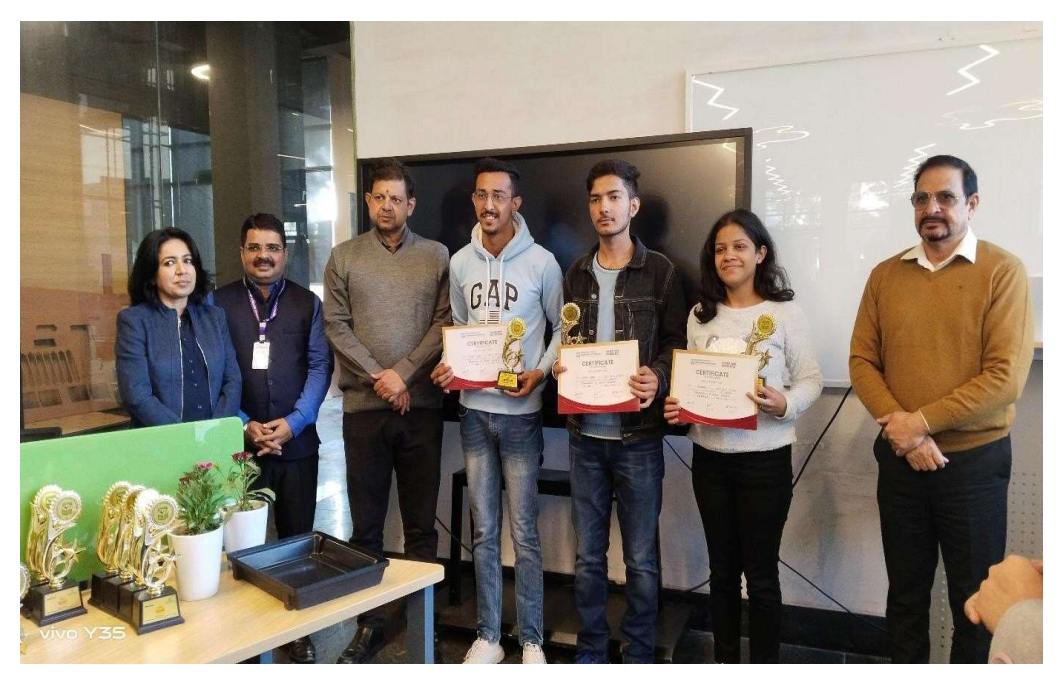
Figure 4: Winning Team (Category- Software)