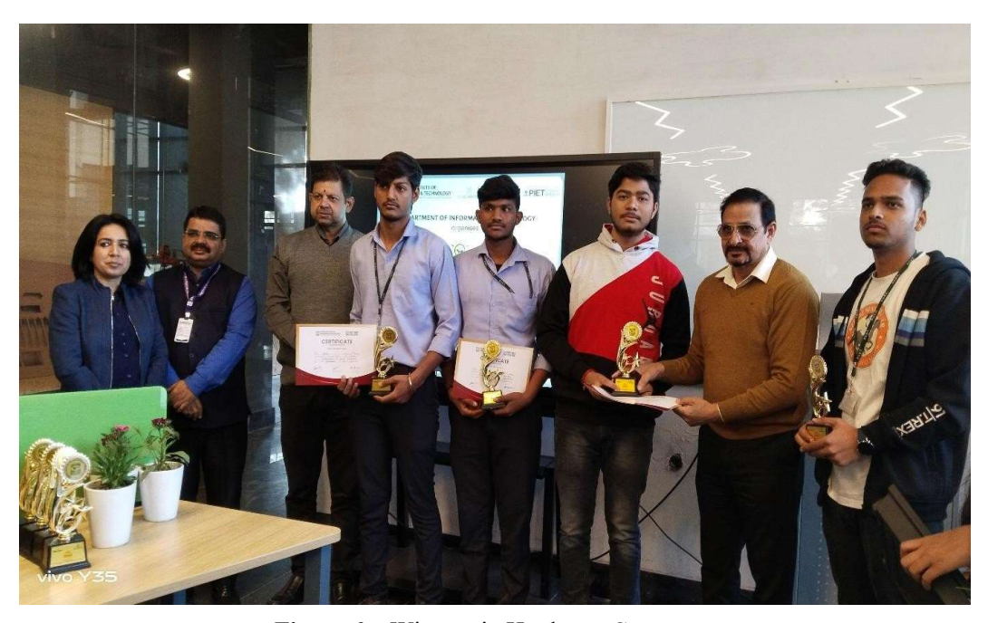
Figure 6: Winners in Hardware Category