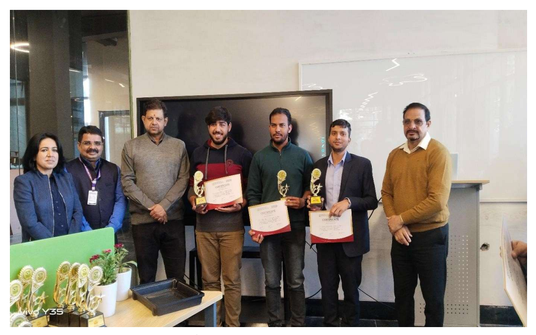
Figure 5: 2<sup>nd</sup> Position Winners(Category-Software)